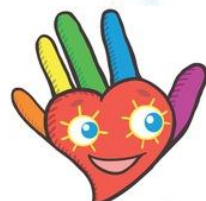
Добровольцы СГУ им. Птирима Сорокина