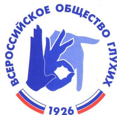
Коми республиканская организация Всероссийского общества глухих (КРО ВОГ)